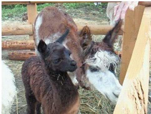
赤ちゃんと母親のドリー

昨年11月に、アメリカコロラド州から山古志油夫集落にやってきて、集落の皆さんによって飼育されている6頭のアルパカ。すでに山古志の